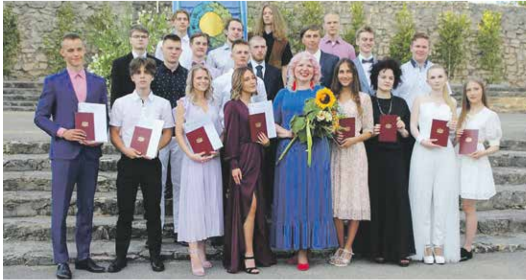
Ikšķiles vidusskolas 12. klases absolventi.

Šogad Ikšķiles vidusskolu absolvēja 20 audzēkņi. Tradicionāli pirmie atestātus un skolas žetongredzenus saņēma skolēni, kuriem vidējais vērtējums mācību priekšmetos ir augstāks par 8,00 ballēm. Par teicamām un izcilām sekmēm