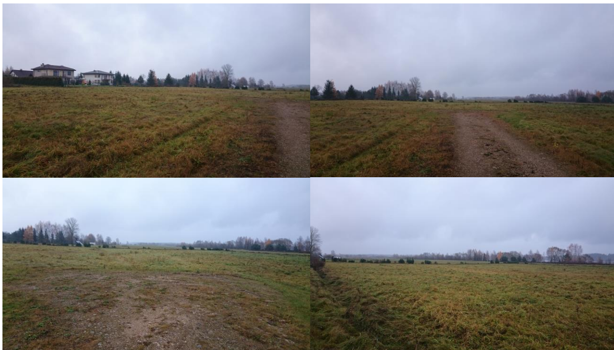
3.attēls. Fotofiksācijas no Detālplānojuma grozījumu teritorijas 03.11.2016.

Zemes vienībām ir nodrošināta piekļūšana no Vecnoriņu ielas, kura ar Zemturu un Rīgas ielām tiek savienota ar pārējo Ikšķiles ielu tīku.